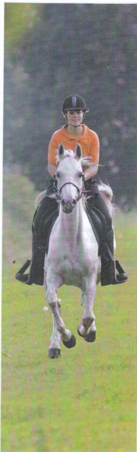
Caro: 'Candor is een heel vrolijk paard en heel ondeugend. Hij werkt heel graag voor mij en is echt mijn maatje.'

endurance kan ik niet zo snel bedenken, al zijn er natuurlijk wel momenten die moeilijk zijn. Bijvoorbeeld tijdens een wedstrijd, als het terrein heel zwaar is of heel saai. Rijden langs een rechte, lange